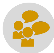
Groupe de discussion Gestionnaires et informateurs clés