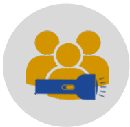
Groupe d'éclaireurs en évaluation

Une démarche d'évaluation a été réfléchi en différentes étapes afin de tenir compte des réalités, du temps disponible et des capacités des acteurs léonardois. Saint-Léonard ne compte pas beaucoup d'organismes dans le milieu et les acteurs engagés actuellement mettent déjà beaucoup d'énergie et ce, sur différents comités de travail du plan de quartier. En ce sens, un comité d'évaluation sous sa forme traditionnelle n'était pas la voie à prendre pour Saint-Léonard. LA SOLUTION ? Mise en place d'un groupe d'éclaireurs en évaluation accompagné par Dynamo et soutenu par un collectif d'acteurs clés. Ainsi, la charge de travail était partagée et du coup, on a renforcé les capacités évaluatives d'un plus grand nombre d'acteurs de la collectivité.