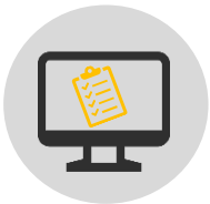
2 sondages en ligne Collaborateurs terrain et citoyens

Une première rencontre collective a amené les acteurs du milieu à travailler ensemble la liste des parties prenantes et la conception des outils d'évaluation. Les données ont été collectées grâce à deux sondages web et un groupe de discussion. Ensuite, les données récoltées ont fait l'objet d'une pré-analyse par codage thématique par le groupe d'éclaireurs en évaluation et d'une rencontre d'analyse collective pour l'interprétation des résultats et l'identification de recommandations avec un collectif de partenaires et citoyens clés. Le groupe d'éclaireurs en évaluation a finalisé les différents outils et documents (plan d'évaluation, grille de sondage et questionnaire, synthèse et rapport d'évaluation, etc.).